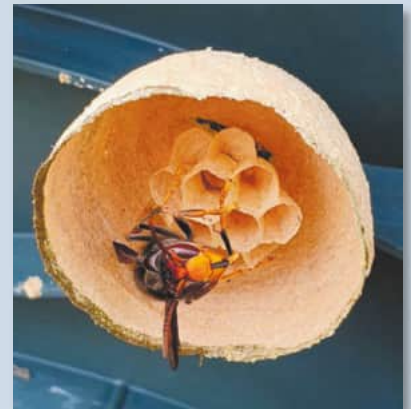
Embryonalnest nur mit Königin (März - Mai)