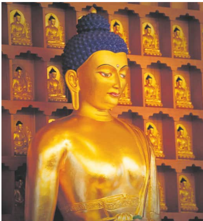
Statue von Buddha Shakyamuni im Bodhi Path Zentrum

Weitere Veranstaltungshinweise gibt es auf der Website www.bodhipath-renchen-ulm.de .